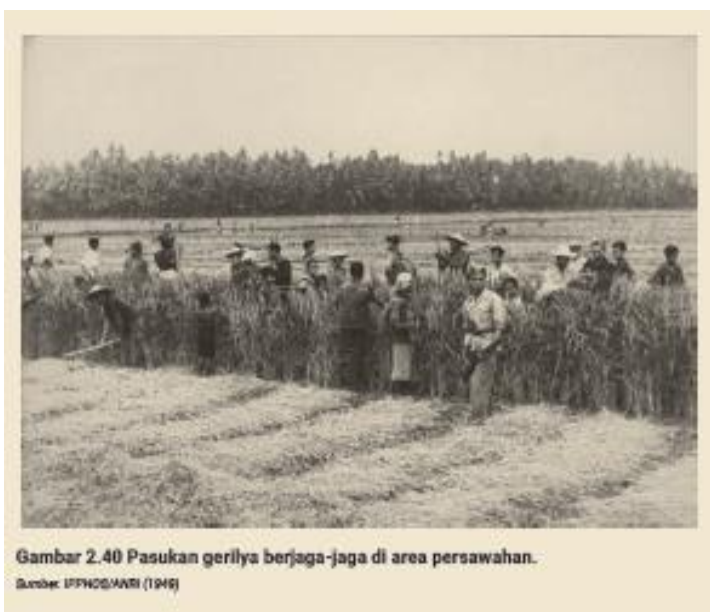
Foto berikut merupakan bagian dari koleksi IPPHOS yang dibuat tahun 1949 dan saat ini tersimpan di Arsip Nasional Indonesia. Pada keterangan gambar yang tertera pada laman ANRI disebutkan “Para pasukan gerilya sedang berjaga-jaga di area persawahan. Tampak para petani sedang memanen hasil pertanian”. Berdasarkan sumber sejarah tersebut, informasi apa saja yang kita dapatkan tentang kehidupan masyarakat di masa revolusi?